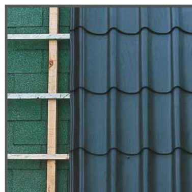
rénovation sur toiture bitumée

On peut appliquer la méthode 'toiture-sur-toiture'.